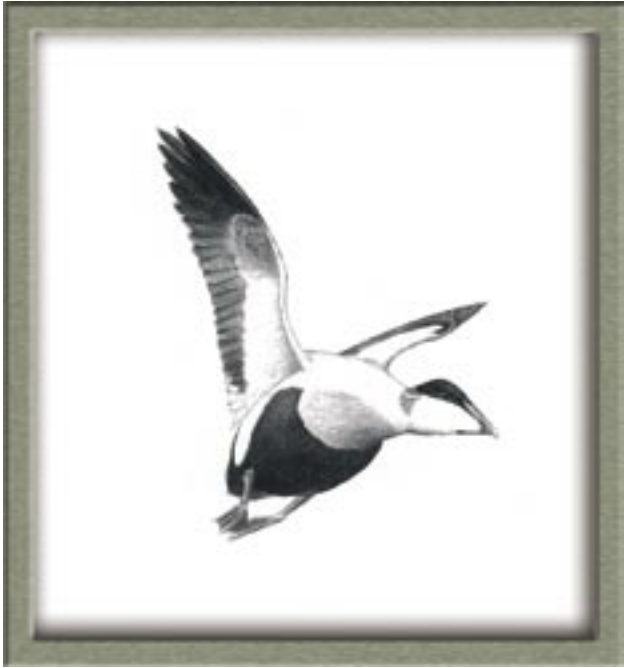
Eiderente, Männchen, Prachtkleid