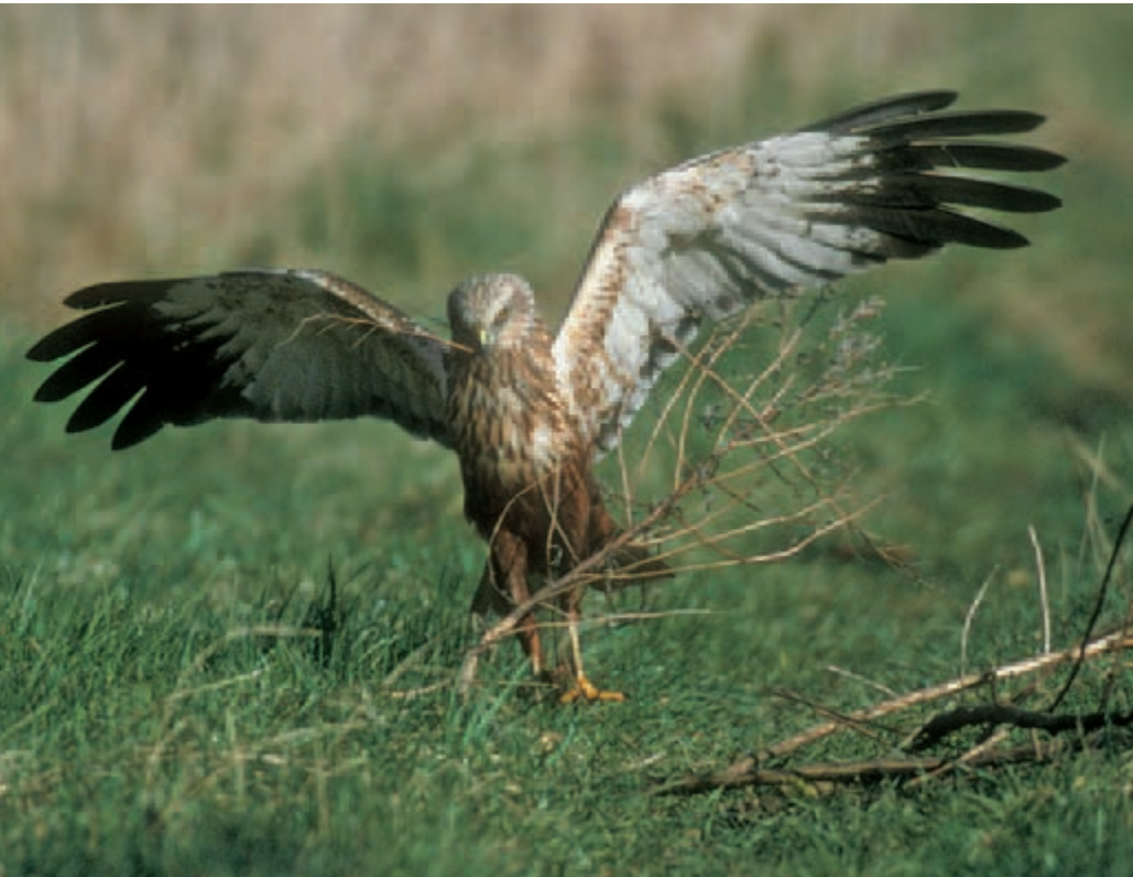
Der Bestand der Rohrweihe (EU Vogelschutzrichtlinie Anhang I) hat in den vergangenen Jahren in zahlreichen Ländern Europas zugenommen.. Foto: R. Lodzig, Raum Celle/Lehrte.

se auf mangelhafte Berücksichtigung der Rechtsgrundlagen und teilweise schlampige Planung zurückzuführen waren – im Vergleich zu jährlich Tausenden von Planungsverfahren, die eben nicht durch „Tiere blockiert“ werden.