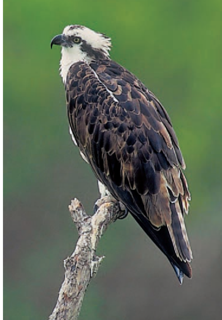
Auf Anhang I der Vogelschutzrichtlinie aufgeführte Arten, wie beispielsweise der Fischadler, weisen einen günstigeren Bestandstrend auf als Vogelarten, die dort nicht genannt werden (Donald u. a. 2007).