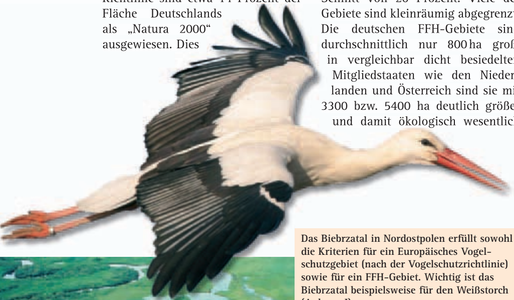
Das Biebrzatal in Nordostpolen erfüllt sowohl die Kriterien für ein Europäisches Vogelschutzgebiet (nach der Vogelschutzrichtlinie) sowie für ein FFH-Gebiet. Wichtig ist das Biebrzatal beispielsweise für den Weißstorch (Anhang I). Lorsch, 30.3.2004.

Die biologische Vielfalt ist also nach wie vor stark bedroht, die Mitgliedstaaten der EU haben sich zum Stopp des Artensterbens bis 2010 verpflichtet, und auf dem G8-Gipfel in Heiligendamm im Juni 2007 stimmten die führenden Wirtschaftsnationen der Welt darin überein, dass der Verlust der biologischen Vielfalt neben Klimawandel und Armutsbekämpfung eine der wesentlichen Herausforderungen des 21. Jahrhunderts sei. Lösungsansätze für diese Probleme sind miteinander eng verknüpft. Man sollte also vermuten,