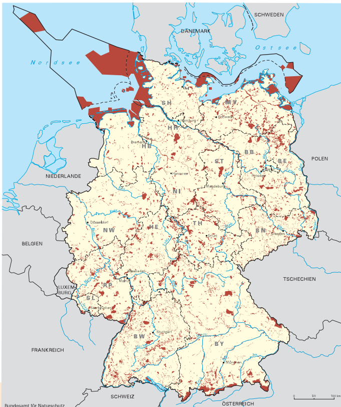
■ FFH-Gebiete Außengrenze der Ausschließlichen Wirtschaftszone 12-Seemeilenzone incl. Tiefwasserreede Bundesamt für Naturschutz