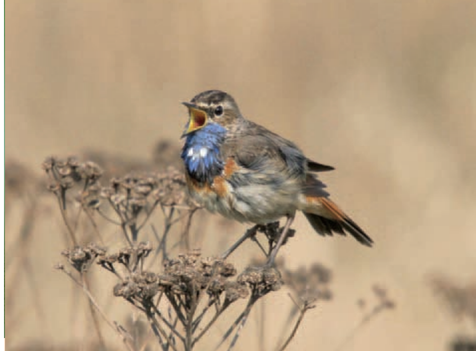
Auch das Blaukehlchen ist eine sogenannte „Anhang I-Art“. Die EU Mitgliedstaaten sind verpflichtet, die zur Erhaltung dieser Arten „zahlen- und flächenmäßig geeigneten Gebiete“ als Schutzgebiete (SPAs = Special Protection Areas) auszuweisen. Foto: H.-J. Fünfstück, Oberfranken, 8.4.2007.

Nach jahrelangen zögerlichen Gebietsmeldungen der Bundesländer ist das Netz der FFH-Gebiete in Deutschland endlich geknüpft. Auch die Meldung der Vogelschutzgebiete (SPAs) steht kurz vor dem Abschluss, nachdem die Europäische Kommission noch im Sommer 2007 eine neuerliche Klage gegen Deutschland vor dem Europäischen Gerichtshof (EuGH) angedroht hatte, da etliche der von ornithologischen Fachverbänden festgestellten IBAs immer noch nicht als SPAs ausgewiesen waren. 28 Jahre nach Inkrafttreten der EG-Vogelschutzrichtlinie und 16 Jahre nach Inkrafttreten der FFH-Richtlinie sind etwa 14 Prozent der Fläche Deutschlands als „Natura 2000“ ausgewiesen. Dies