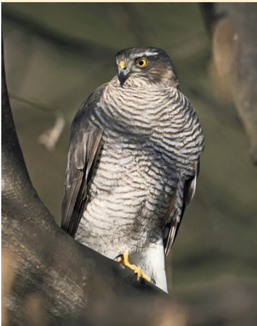
Garmisch-Partenkirchen, 16.2.2008.

Auch mitteleuropäische Sperber gehören zu den Arten, die ihre Zugwege verkürzen.