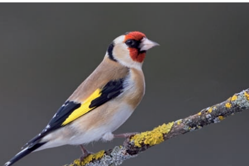
Beim Stieglitz ist die Datenlage nach Ring-Wiederfunden widersprüchlich: Einerseits nehmen Winterfunde im Umfeld der Brutplätze zu, andererseits steigt die durchschnittliche Zugweglänge der Gesamtpopulation an.

Mitarbeiter der drei deutschen Beringungszentralen haben 2004 die Wiederfunde im Winterhalbjahr von beringten Vögeln von 30 deutschen Brutvogelarten analysiert. Dabei konnten bei 13 Arten Hinweise auf eine Verkürzung der Zugwege, bei 11 Arten Hinweise auf eine Nordverschiebung des mittleren Überwinterungs-Breitengrades und bei 9 Arten eine Zunahme der Winterfunde im Umkreis von unter 100km um die Brutgebiete gefunden werden (siehe Tabelle). Nur bei wenigen Arten wurde die gegenläufige Entwicklung beobachtet. Sieben weitere Arten (Blau-meise, Kohlmeise, Rotkehlchen, Star, Hausrotschwanz, Beutelmeise, Rohr-