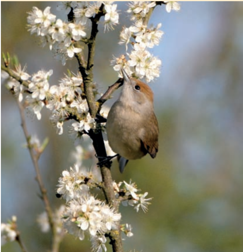
Von der Mönchsgrasmücke gibt es aus Deutschland inzwischen zwar wenige, aber regelmäßige Winternachweise. Foto: H.-J. Fünfstück, Oberfanken, 3.5.2008.

ammer) aus dem selben Datensatz wurden kürzlich mit anderen Verfahren untersucht und für Blaumeise und Hausrotschwanz ergab sich ebenfalls eine statistisch relevante Verkürzung der mittleren Zugstrecken.