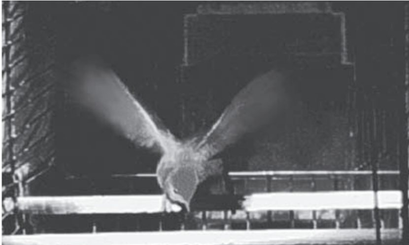
Mönchsgrasmücke unter Infrarotbeleuchtung im Zugruhekäfig. Die nächtlichen Bewegungen werden mit Sensoren aufgezeichnet. Auf diese Weise lässt sich die Menge an Zugaktivität von Kleinvögeln experimentell messen. Foto: Vogelwarte Radolfzell, September 1997.