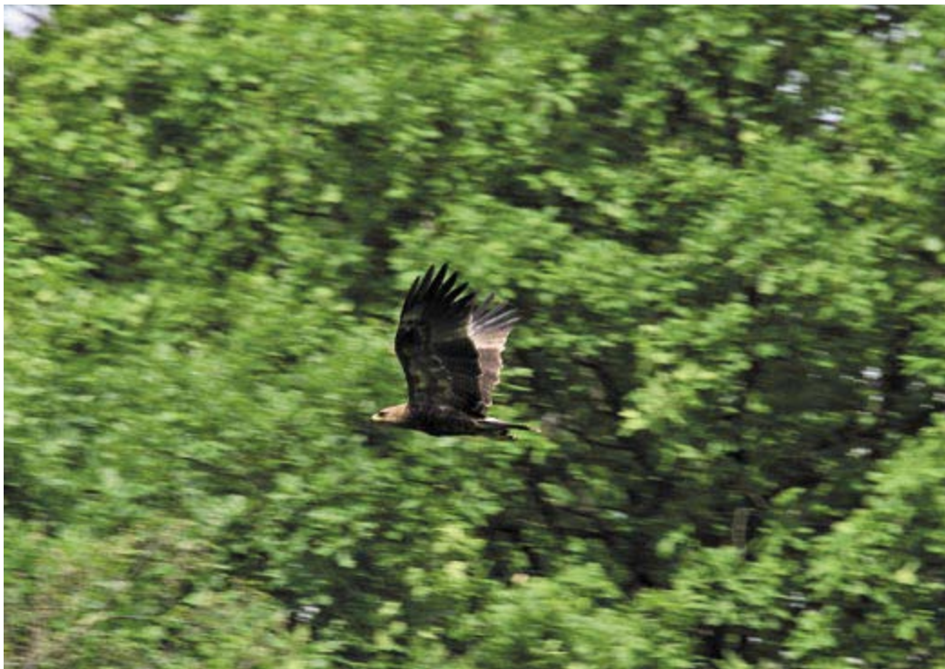
Der Schreiadler ist die am stärksten gefährdete Greifvogelart Deutschlands und in sehr hohem Maße von Schutzmaßnahmen abhängig.

Hiervon werden 30 Arten (11,5% aller bewerteten Arten), darunter auch der Schreiadler, in der höchsten Alarmstufe der Roten Liste, der Kategorie 1 „vom Aussterben bedroht“ geführt. Zehn der aktuell „vom Aussterben bedrohten“ Vogelarten mussten aufgrund ihrer Bestandseinbußen während der letzten 25 Jahre in diese hohe Kategorie eingereiht werden, so z.B. Sandregenpfeifer, Großer Brachvogel, Haubenlerche und Steinschmätzer. In der zweithöchsten Kategorie (2) „stark gefährdet“ finden sich 24 Arten (9%), „die erheblich zurückgegangen oder durch laufende bzw. absehbare menschliche Einwirkungen erheblich bedroht sind“. Dies trifft nach neuesten Erkenntnissen u.a. auf Knäkente, Kiebitz, Steinkauz und Dreizehenspecht zu. Vierzehn weitere Arten sind in der Kategorie 3 „gefährdet“ zu finden (5%), die Bestände dieser Arten sind „nur“ merklich zurückgegangen oder bedroht, in diese Kategorie fallen z.B. Weißstorch, Turteltaube und Feldlerche. 26 der in Deutschland brütenden Vogelarten (10%) haben sehr kleine oder begrenzte Vorkommen und gelten daher als „besonders anfällig gegenüber unvorhergesehenen Gefährdungen“. Diese zur Zeit nicht bedrohten Arten sind in der Kategorie R