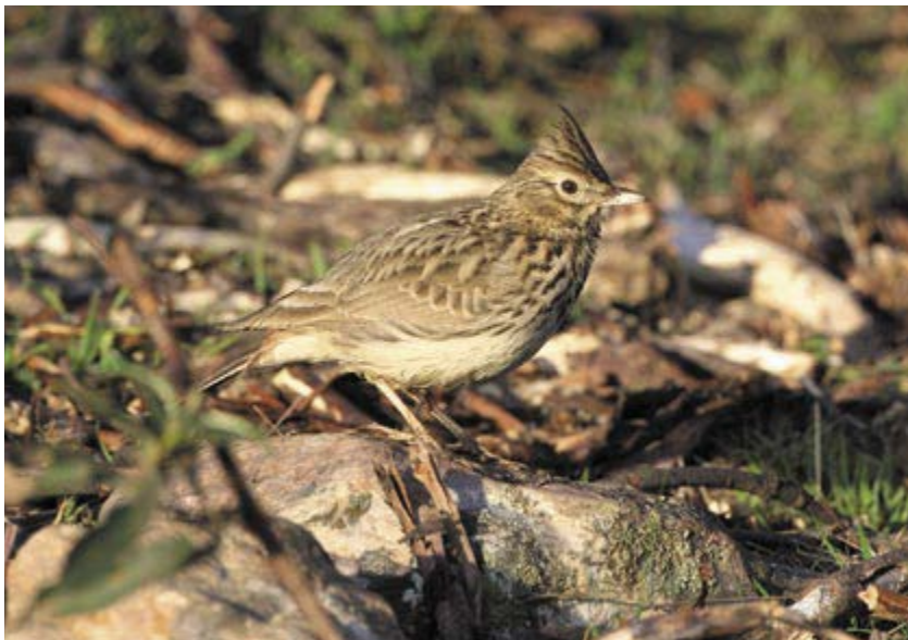
Mit die gravierendsten Bestands- und Arealverluste weist in Deutschland die ehemals sehr häufige Haubenerleche auf. In der neuen Roten Liste muss sie erstmals als „vom Aussterben bedroht“ geführt werden. Extremadura (Spanien), 2.3.2008.

Mittel konsequent anwendet“, sagt Peter Südbek. „Wir sollten für alle aktuell bedrohten Arten spezielle Hilfsprogramme ergreifen. Vogelschutz ist erfolgreich, wenn die wirksamen Gefährdungsfaktoren erkannt und beseitigt werden.“