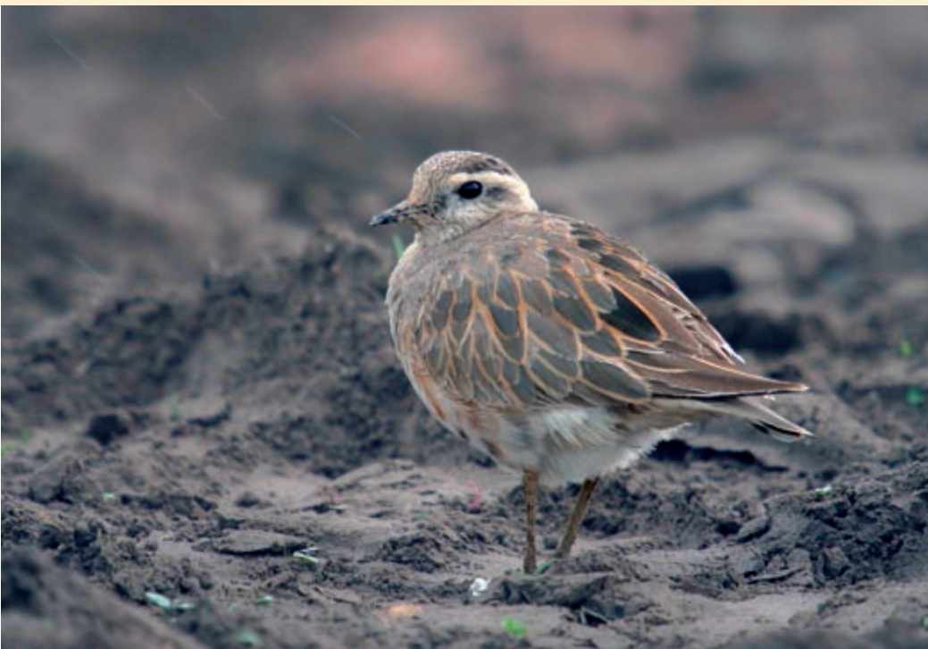
Dieser Mornellregenpfeifer in Hagenbroich – ein lang ersehnter Erstnachweis für den Kreis Viersen – blieb bis zum Birdrace und erfreute drei der dortigen Teams.

an der Pohnsdorfer Stauung (Kreis Plön), ein Kuhreihher am Altmühlsee, ein Zwergadler im Kreis Herford sowie ein Stelzenläufer bei Ulm entdeckt. Und German flight traffic , die offenbar im Rahmen einer Seevogelerfassung am Birdrace teilnahmen, beobachteten erst die zweite Skua im Rahmen des Birdraces. Darüber hinaus sind mehrere Rotfußfalken, Nachtreihher, Weißbartseeschwalben, eine Weißflügelseeschwalbe, ein Sterntaucher in der Grafschaft Bentheim, ein Mornellregenpfeifer im Kreis Viersen, ein Sumpfläufer in der Havel-Niederung, je eine Raubseeschwalbe am Bodensee und im Süden Bayerns sowie ein Halsbandschnäpper im Emsland bemerkenswert.