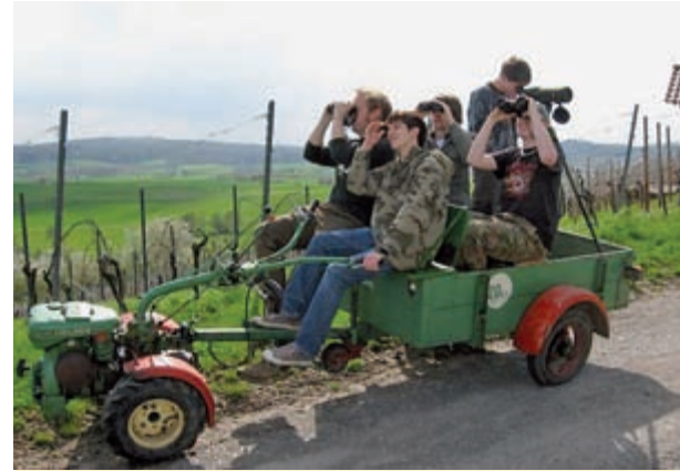
Die Naturschutzjugend Aspach war 2009 zum dritten Mal am Start und eines von sechs Nachwuchsteams. Sie konnten sich von 69, über 71 auf beachtliche 81 Arten steigern und freuten sich u. a. über Flussregenpfeifer, Waldschnepfe, Halsbandschnäpper und Braunkehlchen.

Als Highlights wurden eine Blauflügelente im Holter Hammrich (Kreis Leer), eine Carolinakrickente