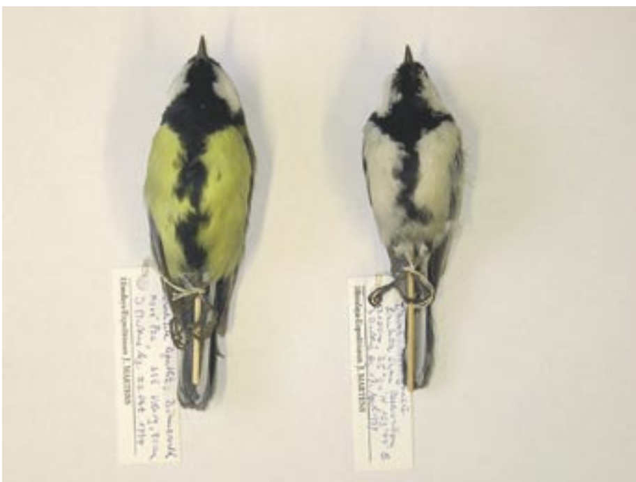
Belegexemplare zweier Formmorphen der Kohlmeise ( Parus major ): gelbbäuchiges Exemplar der major -Subspezies-Gruppe (links, Tschechische Republik/Böhmerwald) und weißbäuchiges Exemplar der minor -Gruppe (rechts, China/Gansu).

Noch dankbarer ist man in der Forschung um Museumsmaterial von extrem bedrohten oder gar ausgestorbenen Tierarten, bei denen die Neubeschaffung von Proben für genetische Studien schnell an ihre